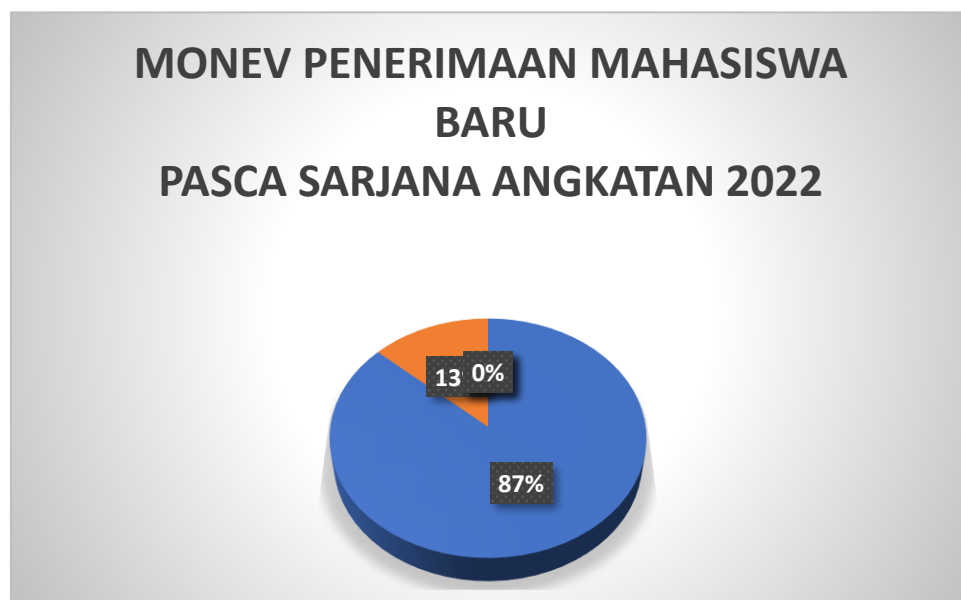
Tabel 2.2 Rangkuman Jawaban Responden Terkait Monitoring dan Evaluasi Penerimaan Mahasiswa Baru.